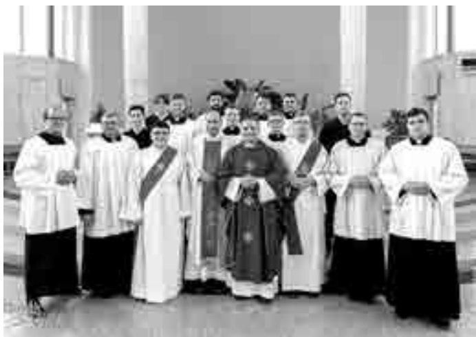
Fotografie: František Ingr. Člověk a víra