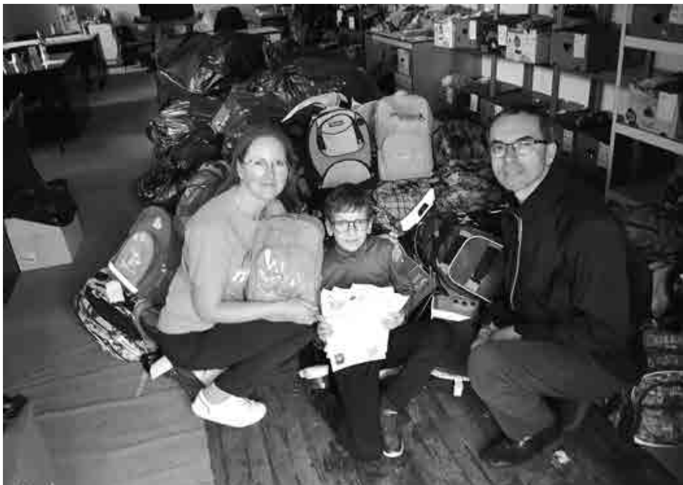
Předání batůžků ve skladu Mary's Meals v Ostravě. Na podzim poputují do Malawi, kde pomohou dětem ve škole.